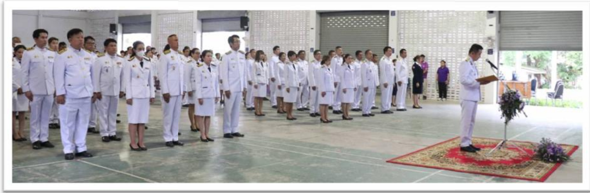
การยึดมั่นในสถาบันหลักของประเทศในด้านศาสนา