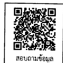
สอบถามข้อมูล