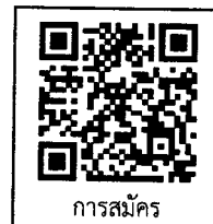
การสมัคร