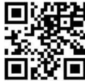
QR Code ดาวน์โหลดระบบแอปพลิเคชัน “พันภัย”

วิธีที่ ๑ สแกนคิว QR Code นำไปสู่การติดตั้งระบบแอปพลิเคชัน “พันภัย” ในระบบ App store หรือ Play store