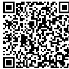
QR Code สื่อประชาสัมพันธ์ แอปพลิเคชัน “พ่นภัย”